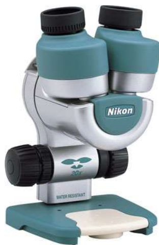
双眼実体顕微鏡(倍率は×20)