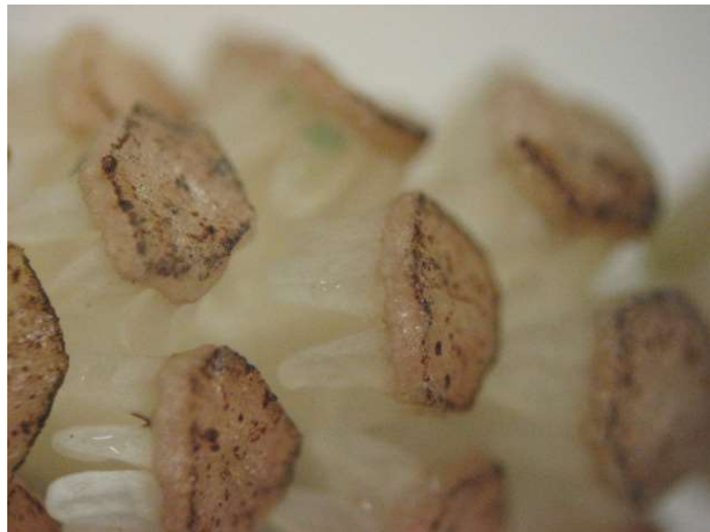
スギナの胞子体 (ツクシ)