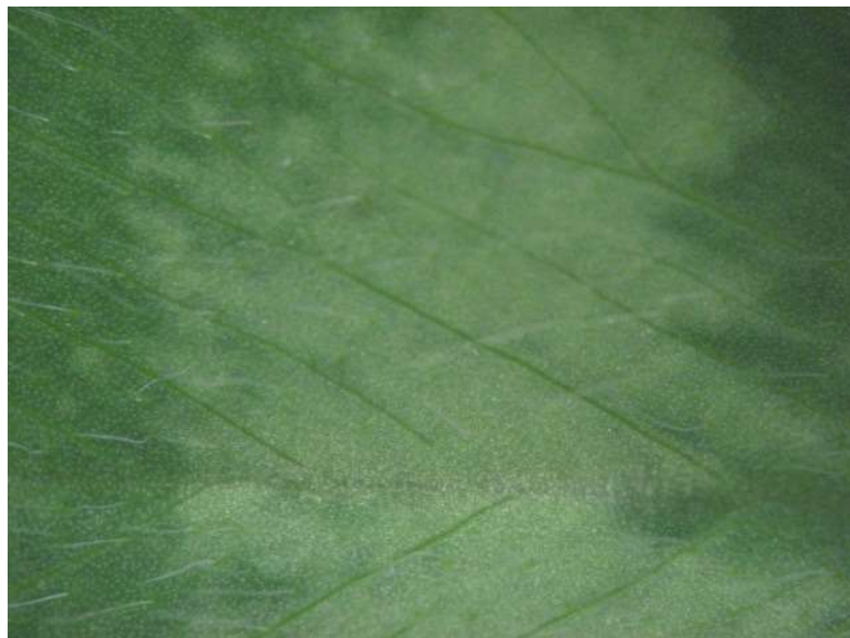
アカツメクサの葉